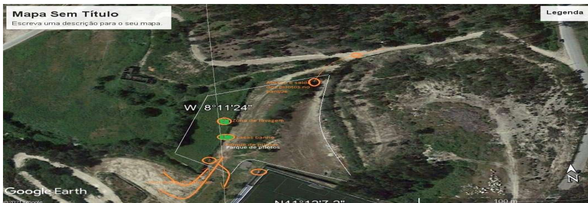
A 4 Marco Canavezes - Vila Boa de Quires