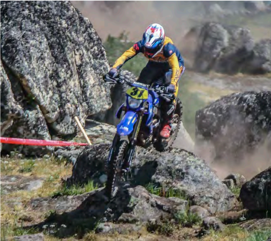
Viveu-se um grande fim de semana de Enduro em Armamar, com a prova do CNE a ter lugar no domingo, depois de, na véspera, se ter aberto o Mini Enduro, onde se inseriram as Clássicas e a estreia das MaxiTrail (em baixo à esquerda)